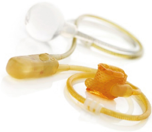
Artifizieller Sphinkter, AMS 800®

Der Eingriff wird unter Vollnarkose durchgeführt und der stationäre Aufenthalt dauert etwa 4–5 Tage.